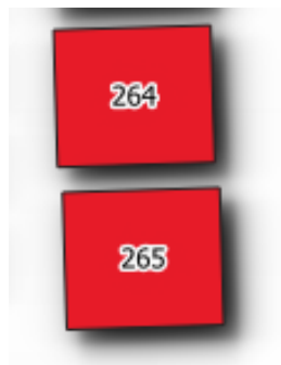
Obr. 1 Ukázka zakreslení obsazených hrobových míst na mapě hřbitova

Grafickou část pasportu představují fotografie hrobů a přehledná mapa hřbitova s vyznačením všech hrobových míst a doplňujících prvků hřbitova. Atributy k výstupnímu mapovému listu se nachází v přílohových evidenčních tabulkách. Zakreslení hrobových míst bylo provedeno na podkladové vrstvě ortofotomapy a za pomoci katastrální mapy ve formě pravoúhelníků s číslem hrobu uprostřed, viz Obr.1 pro obsazená hrobová místa, popř. Obr.2 pro volná hrobová místa.