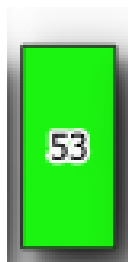
Obr. 2 Ukázka zakreslení volných hrobových míst na mapě hřbitova